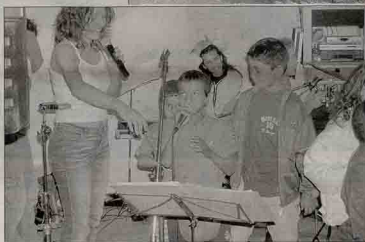
In alto, nella cartina il territorio dei Saharawi. A destra, due immagini del soggiorno dei bambini in Appennino. In basso, un'immagine del deserto del Saharawi.