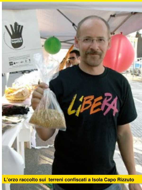
L'orzo raccolto sui terreni confiscati a Isola Capo Rizzuto

'No alla violenza - ha aggiunto don Ciotti - da qualunque parte arrivi. No a chi assassina la speranza. Siamo qui non per esprimere solidarietà ma per esprimere corresponsabilità, desiderio di cambiare per il bene comune. Essere cittadini significa essere corresponsabili perché speranza vuol dire camminare insieme. Siamo qui anche per dire che non possiamo lottare contro le mafie senza le politiche sociali, il lavoro, la tutela dei diritti e delle politiche economiche mirate al territorio. La ricchezza della democrazia è data dalla possibilità e dal coraggio di portare avanti impegni concreti. Quando una comunità è ferita e la dignità spazzata, è messa a rischio la libertà. La rassegnazione non può appartenere al nostro orizzonte. Nessuno si volti dall'altra parte'.