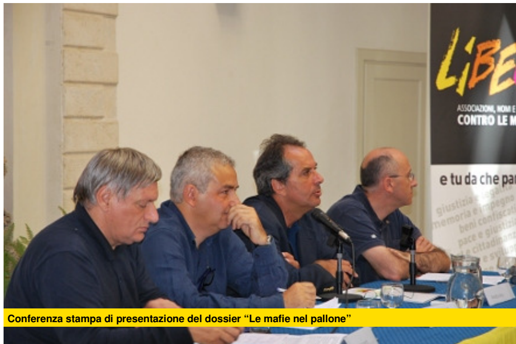
Conferenza stampa di presentazione del dossier “Le mafie nel pallone”

Come reagire? Con il coraggio della denuncia e la forza della proposta: queste le esortazioni di Don Ciotti. Ed è ciò che fanno quotidianamente i ragazzi di Libera, “antenne del territorio”, come le definisce Presidente di Libera, che invoca anche l'indispensabile collaborazione con gli organi competenti.